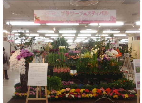
写真：第 35 回フラワーフェスティバル

年に一度の“ちばの花の祭典“が開催されます。会場には千葉県産の切花、鉢花、観葉植物、洋らんが展示されます。ひと足早い春の訪れをお楽しみください。