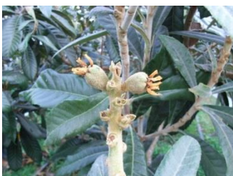
写真 1 頂 2 果