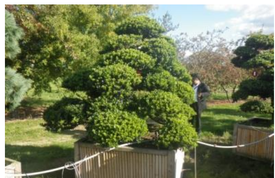
寒冷地でも生育順調なイヌツゲ

県内の輸出業者が EU 諸国向け輸出の中継拠点として提携するポツダム郊外にあるナーセリーは寒冷な地域にあり、輸入したイヌツゲやゴヨウマツ等は順調に生育していました。当ナーセリーの隔離施設で検疫検査を受け、一定期間養生させた植木を EU 諸国に流通させていくため、日本からの輸送時期や根傷み防止など、植木にダメージを与えない輸出方法が求められます。