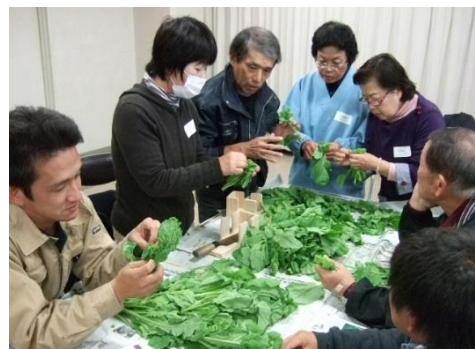
調製方法を指導する部会役員（写真中央）

菜の花部会の役員が講師となり、ほ場づくり、播種、調製作業などの実践的な実習を中心としていることが大きな特徴です。累計参加者は 117 名で、うち 56 名が実際に食用ナバナの出荷を始めていますが、この修了生の中には菜の花部会支部役員になるなど地域に定着し活躍しています。