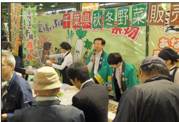
知事自ら試食台での配布・PR

到着した知事の「皆さん、どうぞお食べください」の一言を皮きりに、本県産秋冬野菜をふんだんに使った「旬菜鍋」を知事自ら市場関係者に振る舞い、会場は大いに賑わいました。