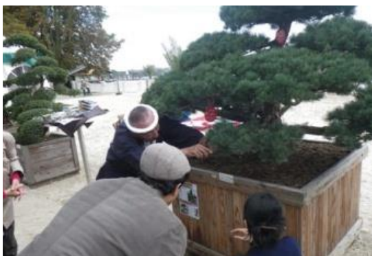
手入れ実演と質問する来場者

ドイツのエッセンで洗練された暮らしの提案を目的に開催された「ホームアンドガーデンショウ」において、千葉県植木生産組合連合会輸出入部会の生産者が植木の手入れの実演を通じた植木の PR を行いました。来場者数は 4 日間で 1 万 2 千人あり、植木の耐寒性や維持管理についての質問がされるなど、日本産の植木や盆栽に対する関心の高さが伺えました。