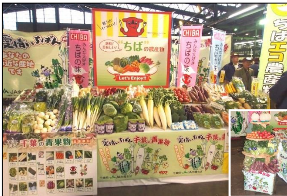
多彩な千葉県の秋冬野菜恒例の野菜タワーも会場を彩ります

会場には、旬を迎えただいこん、キャベツ、にんじん等の野菜や、ちばエコ農産物が所狭しと並べられました。恒例の野菜タワーの頂点には、温室組合連合会のアールスメロンも展示され、会場の買参人の目を引いていました。