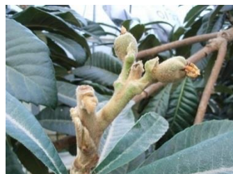
写真 2 下 1 枝 2 果