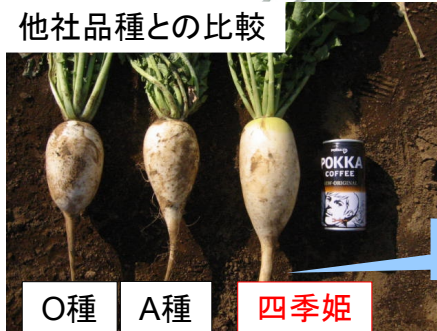
O種 A種 四季姫

※ 収穫物の写真は、実際に収穫される野菜が写真のように完全に再現されることを保証するものではありません。